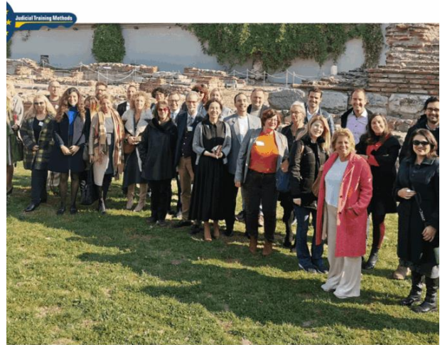
Judicial Training Methods seminar on "Communication and Vulnerability" 10-11 November 2022 - Sofia, Bulgaria

Why do the magistrates have closed eyes and are listening to instructions on how to fold a T-shirt?